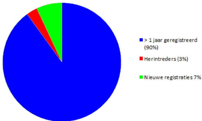
Figuur 1 Registraties in het Kwaliteitsregister Verloskundigen 2014